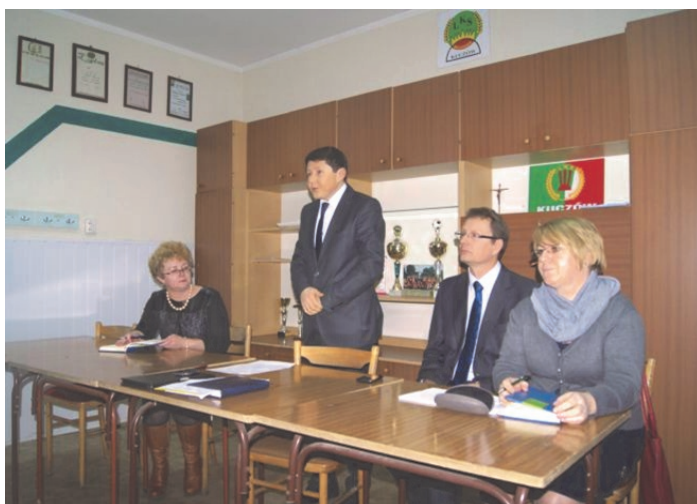
Spotkanie z mieszkańcami w Kuczowie.