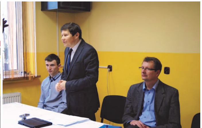
Spotkania z mieszkańcami w Drutarni