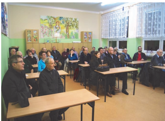
Spotkanie z mieszkańcami w Miotku.