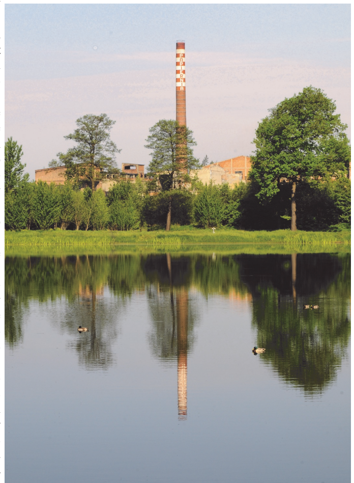
Staw fabryczny.