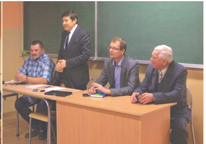
Spotkanie burmistrza i radnych z mieszkańcami w Jędrysku