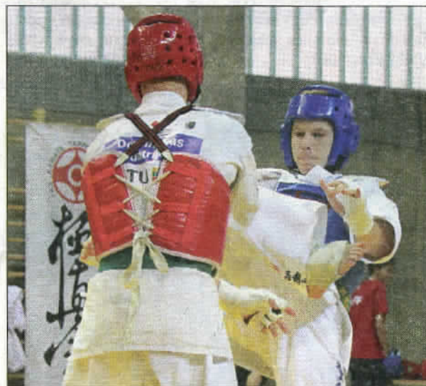
Na zawody przyjechały reprezentacje 18 krajów.